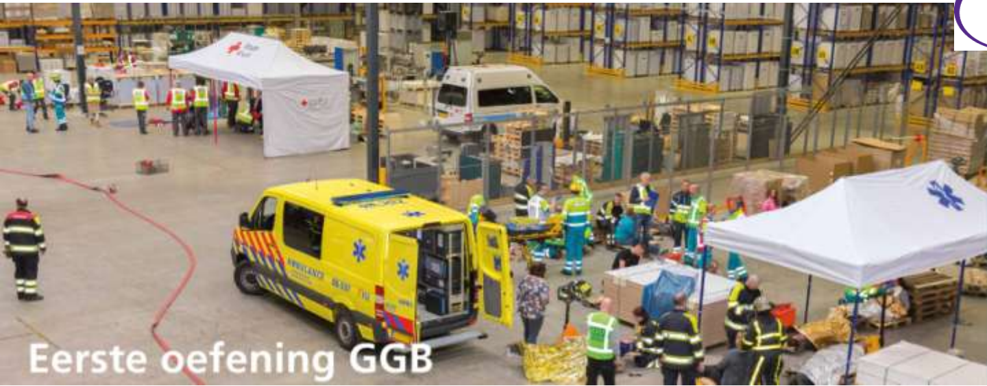
Eerste oefening GGB